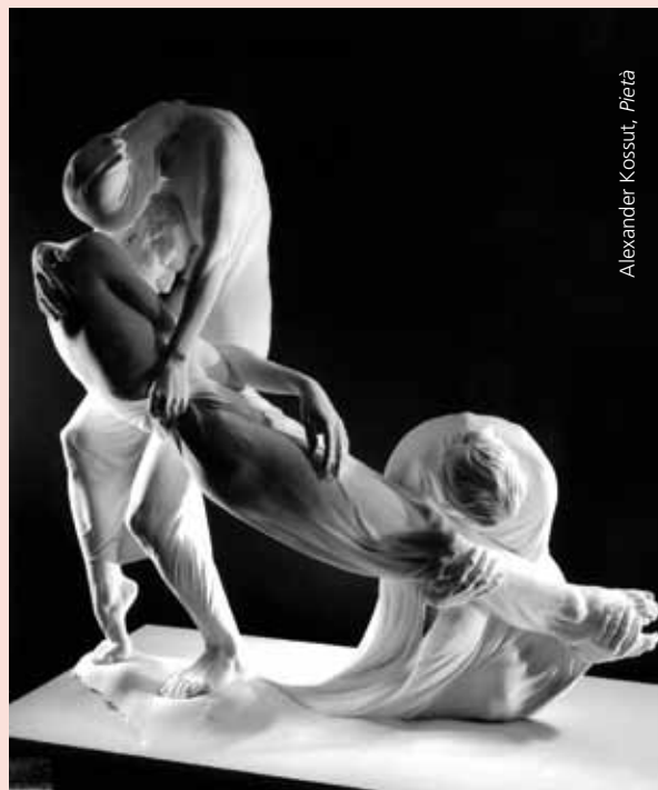
Alexander Kossuth, Pietà