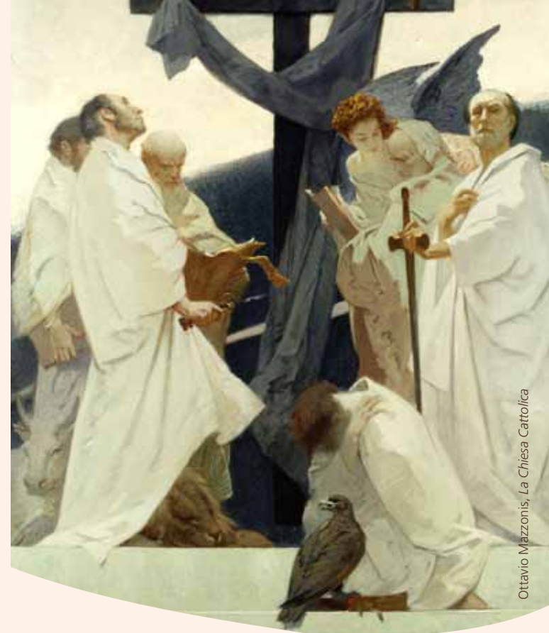
Ottavio Mazzonis, La Chiesa Cattolica

IL SEPOLCRO VUOTO Un percorso d'arte contemporanea intorno alla Sindone