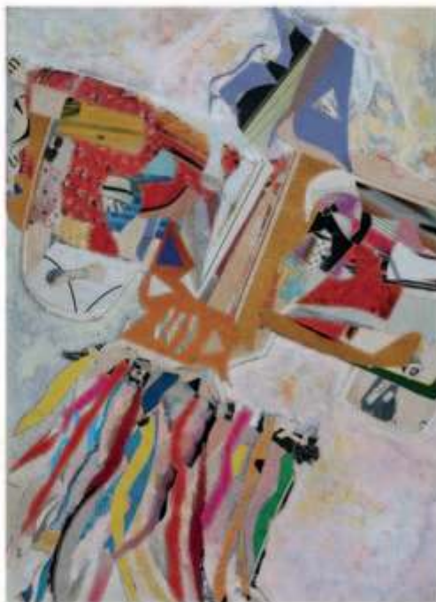
Piero Lerda Aquilone / Papirnati zmaj, mešana tehnika na kartonu / tecnica mista su cartone, 1972