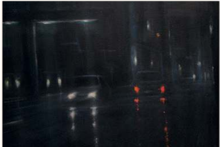
Giafranco Galizio dal ciclo Anonimi percorsi / iz cikla Anonimne poti, akril in olje na lesu / acrilici e olio su tavola, 2010